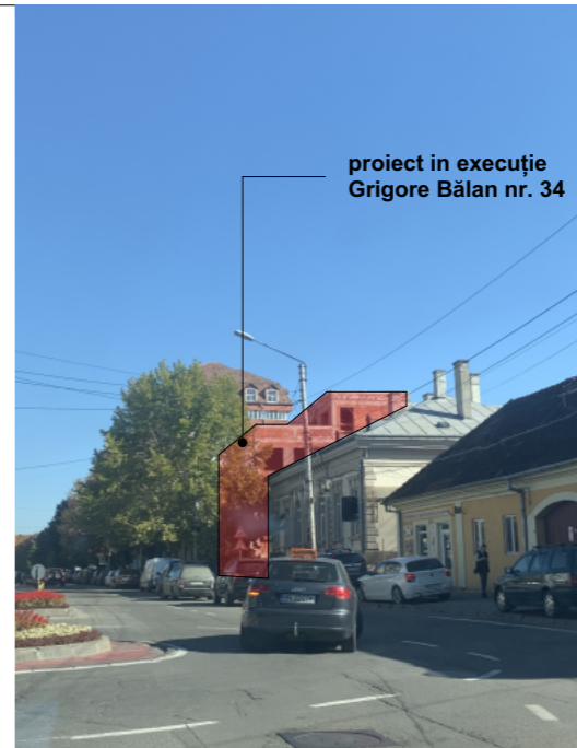
proiect in execuție Grigore Bălan nr. 34